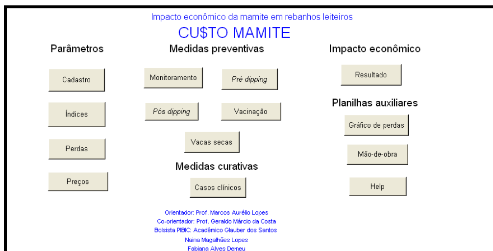
Figura 1. Tela de abertura do CU$TO MAMITE

A tela de abertura possui botões para auxiliarem na navegação entre as 14 planilhas pertencentes aos grupos parâmetros ( Cadastro, Índices, Perdas e Preços ), medidas curativas ( Casos Clínicos ), medidas preventivas ( Monitoramento, Pré e Pós-dipping, Vacinação e Vacas secas ), impacto econômico ( Resultado ) e planilhas auxiliares ( Gráfico de perdas, Mão de obra e Help ) ( Figura 1 ).